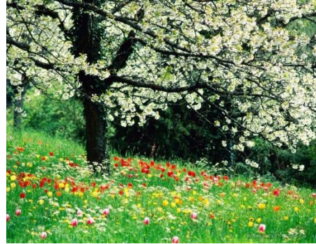
- Imaginea nr.2 -