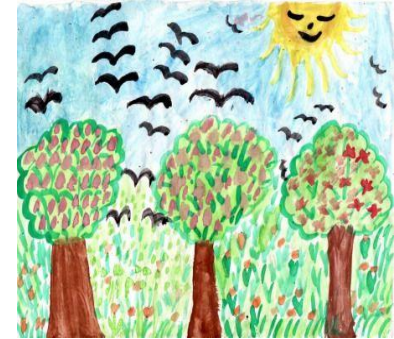
- Imaginea nr.3-