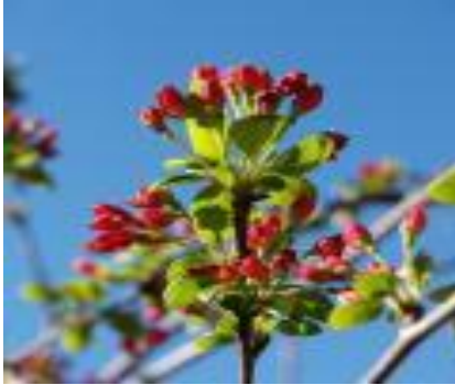
- Imaginea nr.1 -

1. Formați propoziții cu ajutorul imaginilor de mai jos :