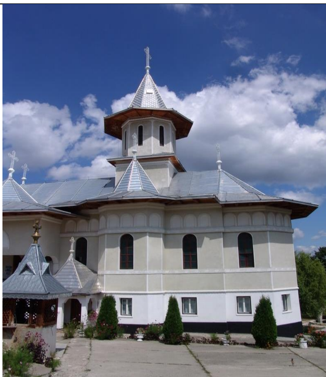
Fig. 3. Mănăstirea Bic