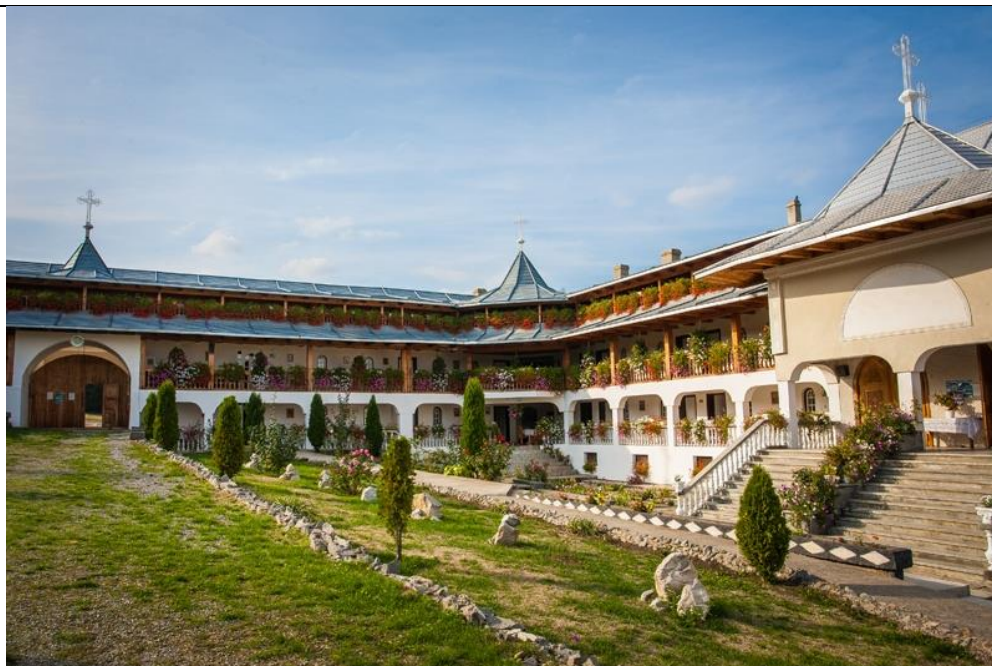
Fig. 4. Curtea Mănăstirii Bic