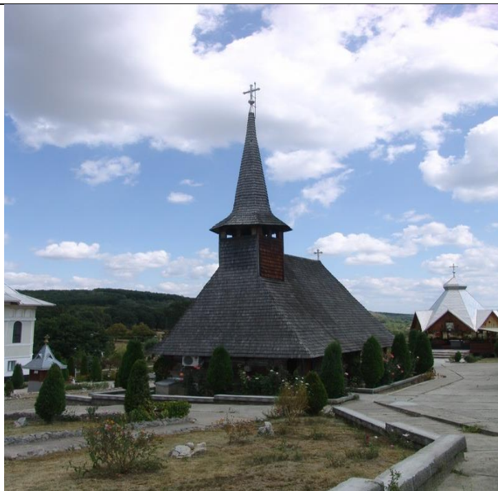
(Foto: Fig. 2. Biserica de lemn de la Mănăstirea Bic http://www.manastireabic.episcopiasalajului.ro/upload/articol/467/biserica%20veche%20manastirea%20bic%20%20%20009.jpg )