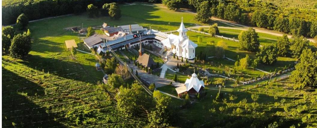
Fig. 1. Mănăstirea Bic-Complexul monahal