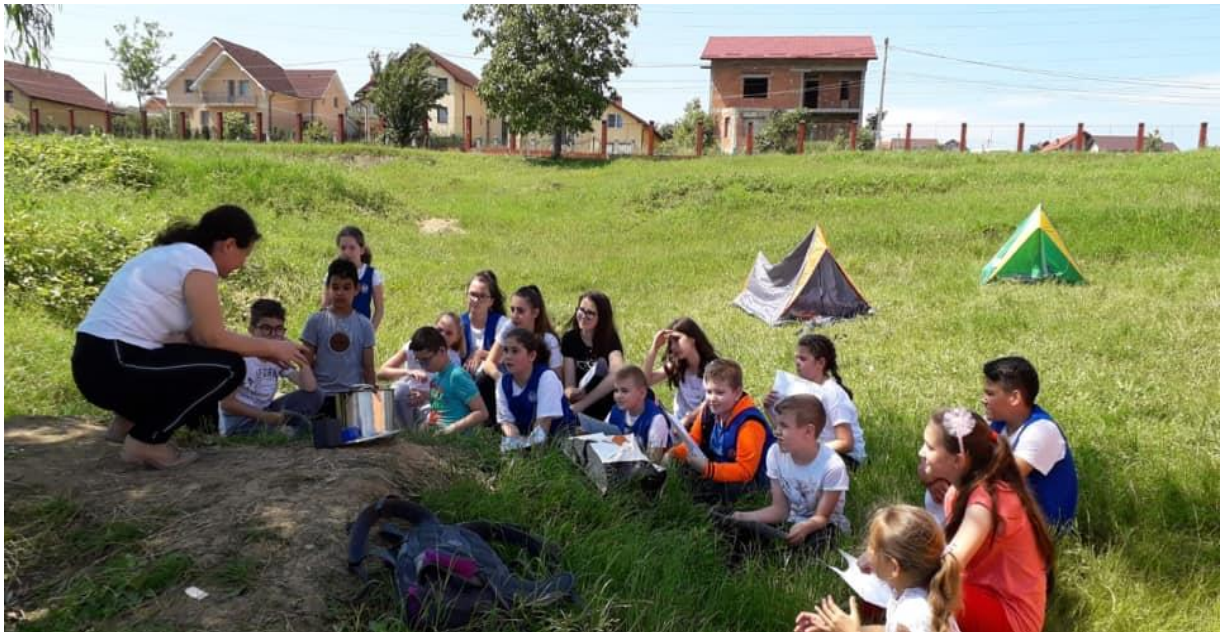
Activitate cu echipa de cercetași