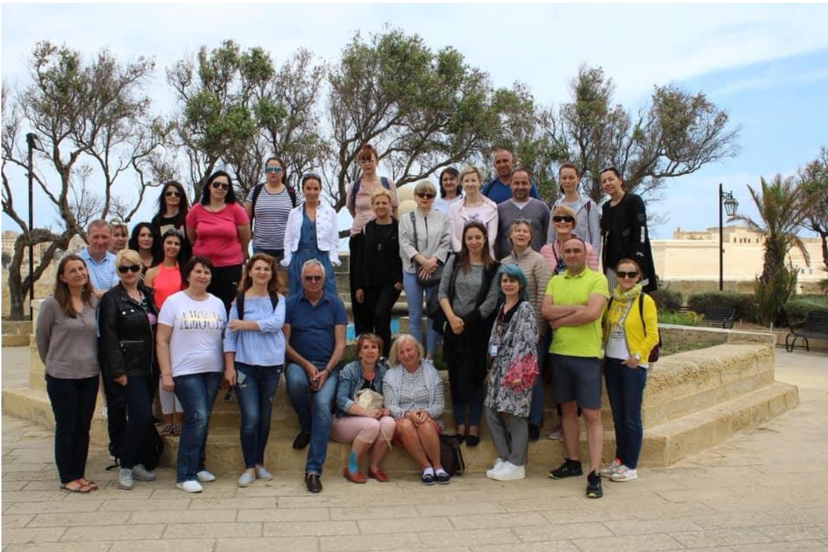
Activitate de mobilitate - Malta