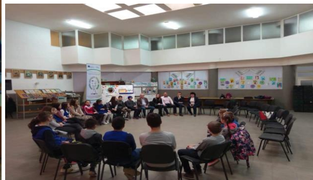
Întâlnire cu elevii și părinții acestora cuprinși în acest proiect