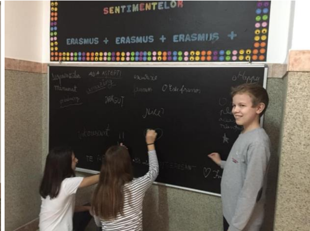
Zidul Trăirilor și al Sentimentelor