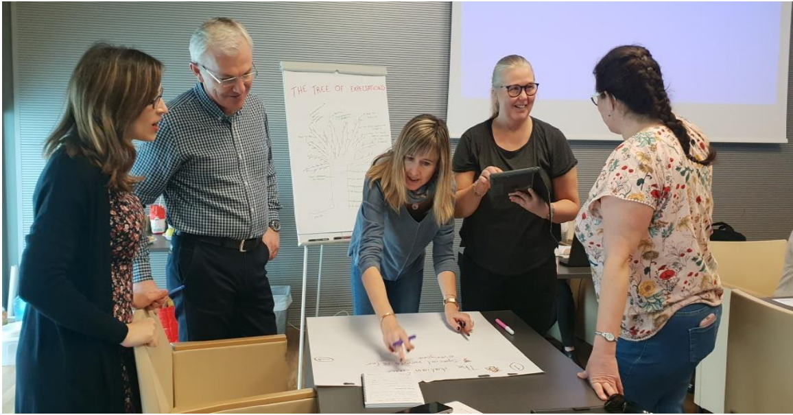
Activitate de mobilitate – Italia